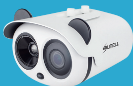
サーマルカメラによる 検温の実施