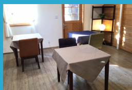
座席数を減らした カフェスペース