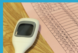
従業員・同居家族に発熱などの 症状がみられた場合の会社制限