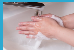
スタッフの 手洗い徹底