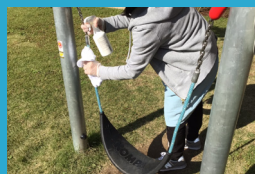
屋外遊具の 除菌液での定期消毒