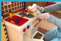
託児用玩具の 除菌液での定期消毒