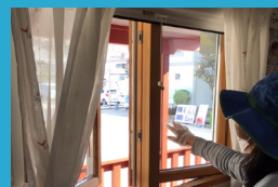
定期的 換気を実施