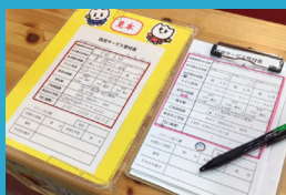
予約制による1組ごとの 無料託児サービス