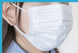
全スタッフの マスク着用