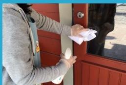
テーブル、ドアノブなど 除菌液での定期消毒