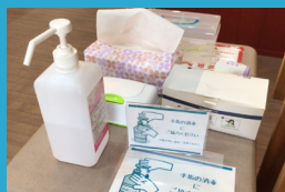
スタッフ及来場者用 マスク完備